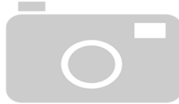
IMAGEN NO DISPONIBLE